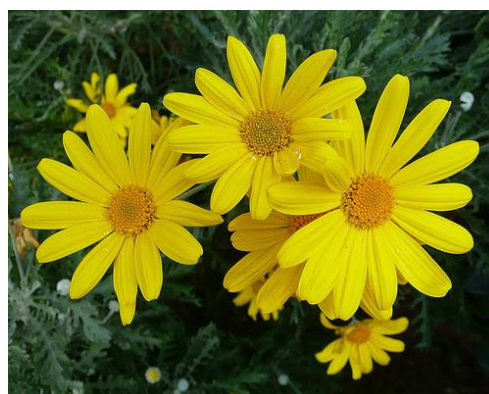
margaréta – 450 Ft/szál