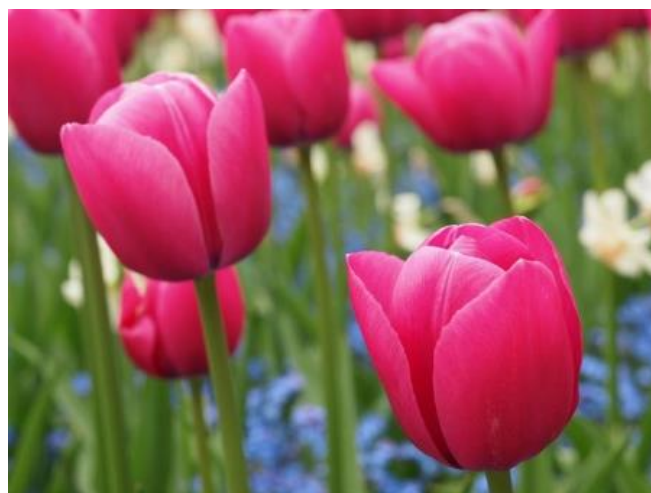
tulipán – 300 Ft/szál