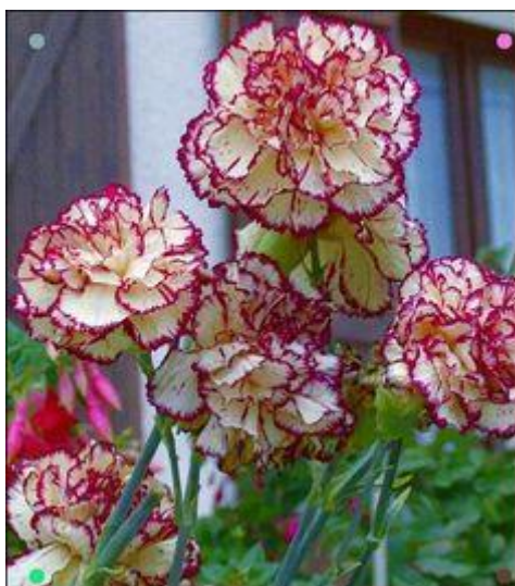
szegfű – 600 Ft/szál