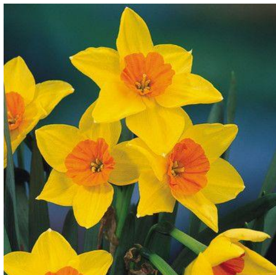
nárcisz – 450 Ft/szál