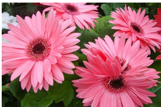
gerbera – 700 Ft/szál