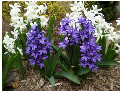
jácint – 890 Ft/szál