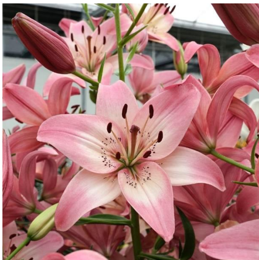
liliom – 1500 Ft/szál