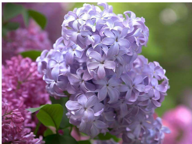
orgona – 550 Ft/szál