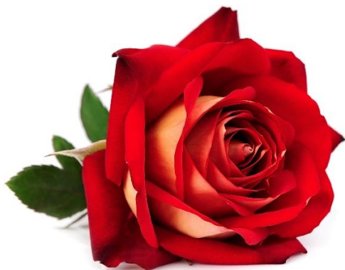
rózsa – 1100 Ft/szál